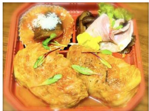
おつまみロールキャベツ弁当 肉厚ロールキャベツの 700円 おつまみセット(ご飯なし)