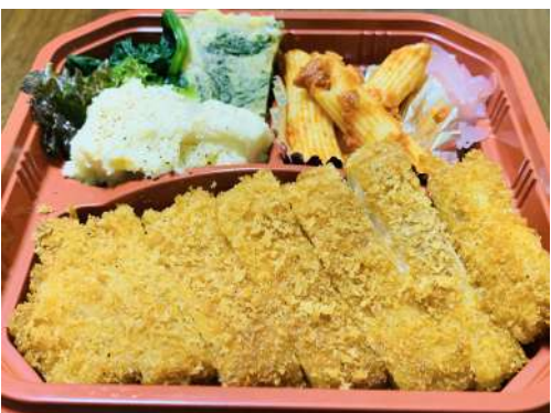
おつまみチキンカツ弁当 さくっとカツメインの 650円 おつまみセット(ご飯なし)