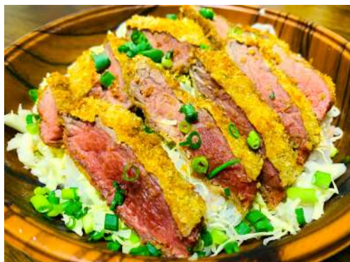
葡萄牛ランプの柔らか牛カツ丼 旨みたっぷり葡萄牛 1000円 150gの贅沢丼ぶり