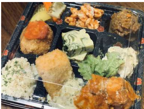
イタリアン弁当 800円 お魚、お肉、パスタやご飯の 9品目のお弁当