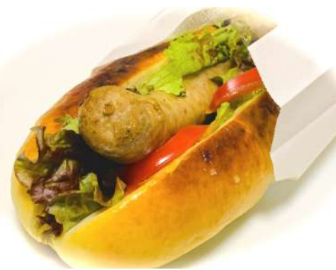
ホットドッグ グランデ!!!! 自家製コッペパンと 800円 自家製サルシッチャの特大ドッグ そのまま口に入りますか!?