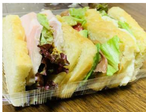
Gatti 3トッピングサンド 550円 アボカドコンソメ漬け、王様の ポテトサラダ、自家製ロースハム 当店人気のおつまみ3種サンド