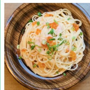
明太子といくらの スパゲッティニ 920円