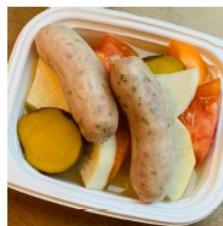
ソーセージと 根菜のポリート 400円