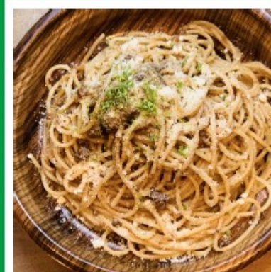
シェフ自信作！ 本場のボロネーゼ 980円