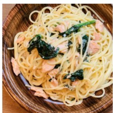
サーモンとほうれん草の クリームソース 840円