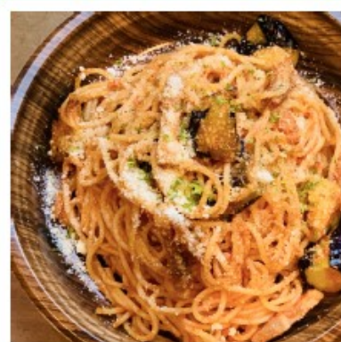
ベーコンとナスの アラビアータ 880円