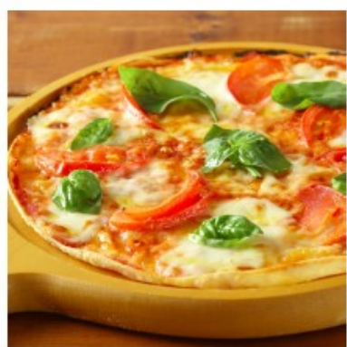
ピッツァ マルゲリータ 700円