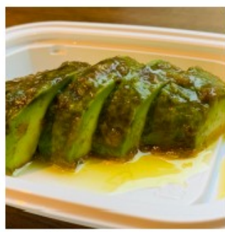
アボカドの コンソメ漬け 200円