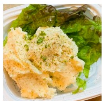
玉様の ポテトサラダ 300円